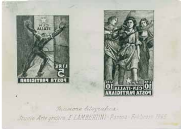
Particolare della pietra litografica conservata presso l'Istituto Storico della Resistenza di Parma con i disegni originali, ovviamente speculari, di Libero Tosi

superiore a ogni tariffa postale dell'epoca, fanno pensare a un utilizzo per un servizio di posta privata; e, data la zona in cui operava il CLN parmigiano, è da ritenere che tale servizio — ispirato forse ai Coralit o al SEIS (che aveva un recapito a Parma) — dovesse svolgersi attraverso l'Appennino, in direzione della Toscana già liberata, ovvero zone in cui i partigiani si muovevano con una certa sicurezza e avrebbero potuto rischiare anche il trasporto di corrispondenze. A costi giustamente elevati, s'intende.