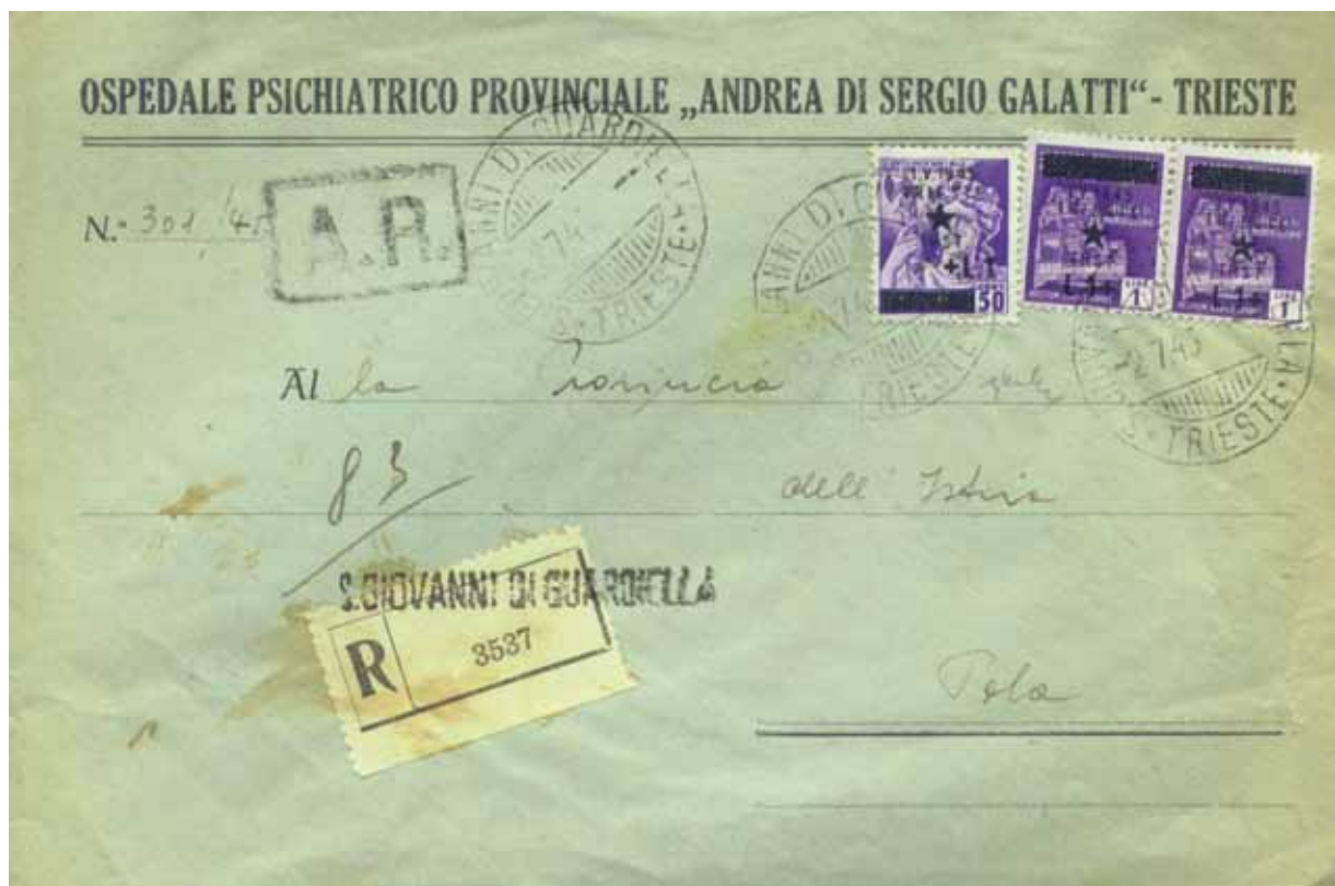
Raccomandata spedita il 2 luglio 1945 da San Giovanni di Guardiella (poi Trieste 14) a Pola. I francobolli da 50 cent. e 1 lira in pratica furono gli unici effettivamente usati per posta, malgrado il sovrapprezzo

Ma, forse dopo aver avuto notizia delle emissioni dei CLN italiani, il Comitato Regionale di Liberazione Nazionale per il Litorale Sloveno e Trieste, o Pokrajniskinarodno Osvobodilni Odbor za Slovensko Primorje in Trst, decise che sarebbe stato sciocco non approfittare dei milioni di francobolli giacenti presso la Cassa provinciale di Trieste per incassare un po' di soldi dai collezionisti. E a fine maggio fece decretare un'emissione celebrativa della liberazione di Trieste (con stella rossa — anche se solo in qualche caso, per ragioni di inchiostro! — per attribuirne il merito agli iugoslavi, anche se erano stati i partigiani italiani a occupare per primi i principali palazzi pubblici di Trieste, il 30 aprile 1945) con un sovrapprezzo “destinato per i poveri della città” . Ovviamente tali francobolli erano facoltativi, in alternativa al pagamento in contanti presso gli uffici postali; ma era chiaro che chi voleva semplicemente imbucare non aveva altro modo che