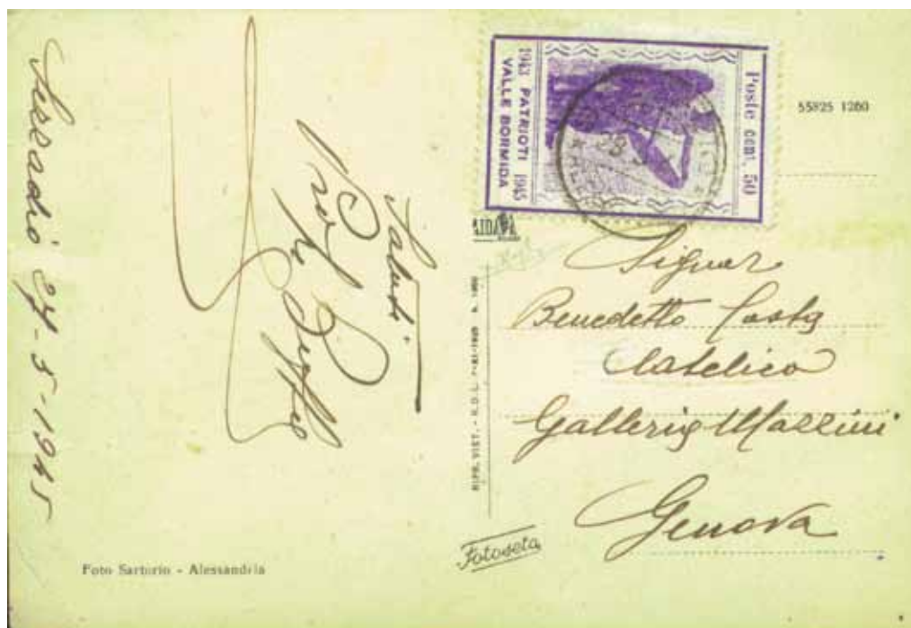
La «Vittoria alata» da 50 cent. su cartolina illustrata spedita da Sezzadio il 28 maggio 1945 e diretta in Liguria

Il giorno 26 il C.L.N. di Castelnuovo Bormida dichiarava fuori corso i francobolli della «Repubblica Sociale Italiana» e riconosceva come ufficiale soltanto la emissione dei patrioti. Il medesimo decreto venne adottato da Sezzadio lo stesso giorno, da Castelspina e