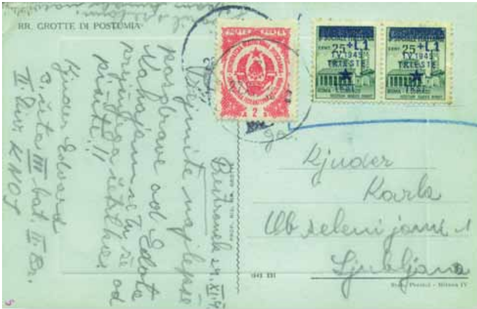
Due francobolli triestini usati per affrancare una cartolina spedita da Postumia a Lubiana il 24 novembre 1945. Ma nella zona sotto controllo jugoslavo la serie di Trieste, per quanto creata dal CLN fedele al gen. Tito, non era ritenuta valida, e la cartolina all'arrivo venne all'arrivo tassata

detraendola dall'utile complessivo del sovrapprezzo — al 22 giugno ammontava già a 4 milioni di lire, delle 8.977.600 ottenibili in caso di vendita totale — che non venne mai consegnato al CLN Regionale, malgrado le ripetute richieste.