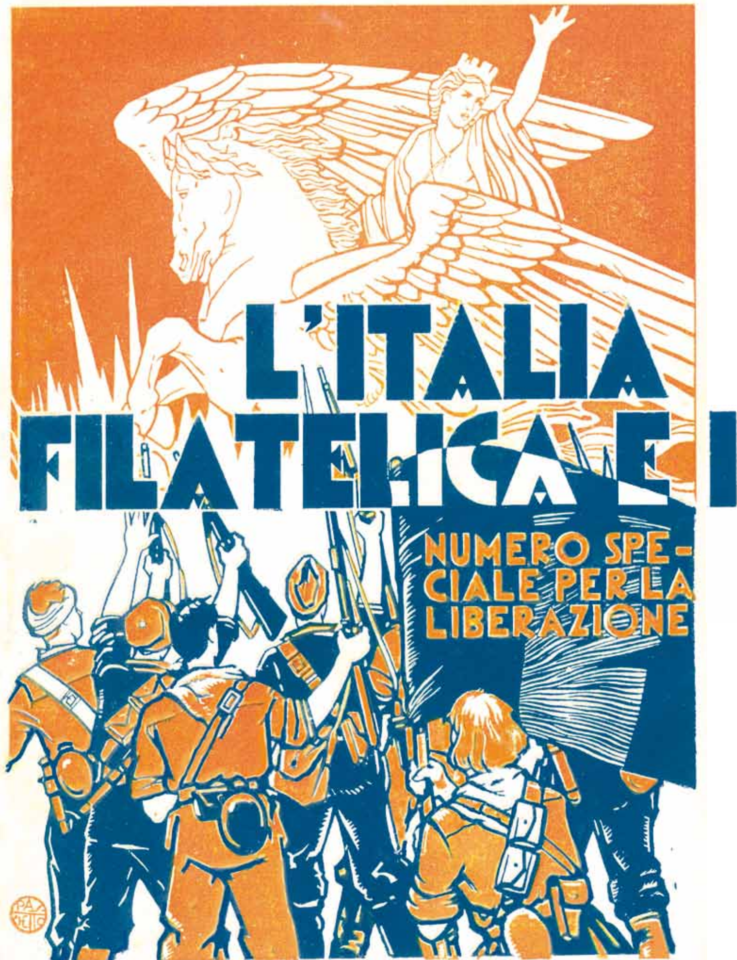
La copertina creata da Paolo Paschetto per il n. 6 della rivista Italia Filatelica, del giugno 1945